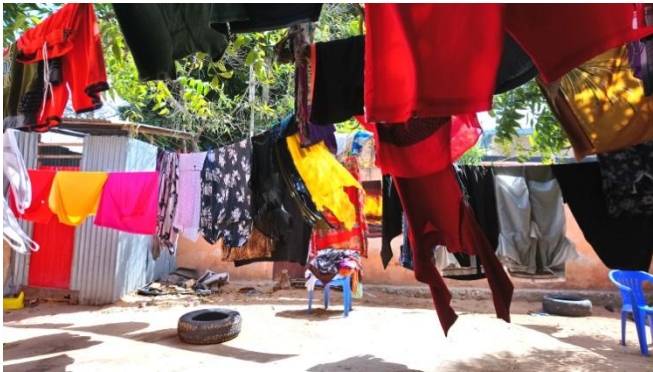
Sawir qaade: Casho, Muqdisho

badan dadkii la wareystay waxa ay ku tiirsanaayeen hal-abuurro yaryar ama shaqo maalmeed: dumarka inta badan waxa ay garaacaan albaabada guryaha si ay shaqo u helaan sida dhar dhaqista, nadiifinta guryaha ama howlaha kale ee guriga. Ragga iyo mararka qaar dumarka waxa ay ku shaqeystaan xamaalinimo ama waxa ay ku dadaalaan in ay shaqo ka helaan mid kamid ah goobaha la dhisayo ee magaalada. Tartanka wuu sarreeyaa dadkana inta badan waxa ay u baahan yihiin in ay xiriir shakhsi ama mid qabiil ku helaan shaqada suuqa. Dadka ku cusub magaalada intooda badan ma laha xiriir fiican.