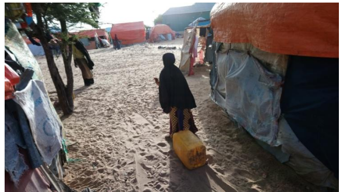
Sawir qaade: Hawa, Muqdisho

Marka la eego dhibaatooyinka jir iyo dhaqaale oo ay wajahaan, barakacayaasha waxa ay u nugul yihiin khataraha amni ee jirkooda marka ay joogaan xeryaha barakacayaasha iyo gudaha magaalada. Waxaa jira warbixinno dhowr ah oo muujinaya khataraha dhaca iyo kufsiga gaar ahaan dumarka aada goobo ka baxsan xerada barakaca si ay usoo shaqeyaan. Dumarka waxa ay ka hadleen in ay khatarahan ku yareeyaan iyagoo ka fogaanaya in ay xerada ka baxaan habeenkii, in ay koox isku raacaan marka ay shaqada raadsanayaan, iyo in ay isticmaalaan taleefoonnada gacanta si ay iskula xiriiraan. Guryaha xerooyinka barakacayaasha oo aana si fiican u dhisneyn ayaa difaac yar ka siiya in dad kale kusoo duulaan ama ka difaacan dagaallada u dhexeeya maleeshiyoyinka, dambiiashaasha iyo xoogagga amniga. Dadka la wareystay waxa ay ka hadleen dad ay ku dheceen xabado wiifto ah ama hoobiye.