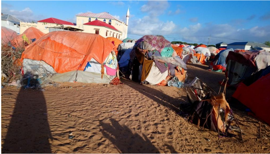
Sawir qaade: Casho, Muqdisho - Kaam barakacayaal

(Maarso 2019) Daraasaddan waxa ay soo koobeysaa natiijooyinkii ugu muhiimsanaa ee mashruuca cilmibaarista ee Amniga iyo Dhaqdhaqaaqa ee la sameeyay intii u dhexeysay 2017-2019. Mashruuca Amniga iyo Dhaqdhaqaaqa oo ay maalgeliyeen DFID iyo ESRC waxa uu diiradda saarayay aragtiyada iyo khibradaha dadka barakacay oo deegaan ka dhigtay afarta magaalo ee Baydhabo, Boosaaso, Hargeysa iyo Muqdisho. Afartan magaalo waxa ay hoos tagaan maamullo siyaasadeed oo kala duwan, laakiin waxa ay wadaagaan dabeecado guud. Marka koowaad, waa magaalooyin si xowli ah u koraya dhanka cabbirka iyo cufnaanta, midda labaad, oo ah mid kamid ah waxyaabaha ugu muhiimsan ee keenay kobocan, waa isu guurguur xooggan oo gudaha dalka ah oo ay sababtay barakac khasab ah. Inkastoo waxyaabo badan oo la xiriira xaaladda dhaqaale iyo bulsho ee dadka barakacay ay wadaagaan magaalooyinka, waxaa jira kala duwanaa dhinaca khibrada taariikheed ee ‘magaaleynta xeryaha barakacayaasha’ iyo dadaallada gudaha iyo kuwa caalamiga ah ee lagu maareynayo xeryaha barakacayaasha iyo goobaha kale oo ay degaan barakacayaasha. Qoraalkan kooban waxa uu diiradda saarayaa khibrada barakacayaasha Muqdisho, oo ah caasimadda Jamhuuriyadda Federaalka Soomaaliya.