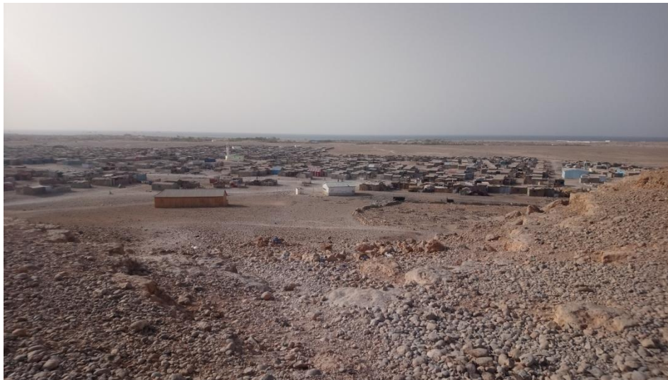
Sawir qaade: Nuuraw, Bosaaso - Deegaanka cusub ee barakacayaasha

(Maarso 2019) Daraasaddan waxa ay soo koobeysaa natiijooyinkii ugu muhiimsanaa ee mashruuca cilmibaarista ee Amniga iyo Dhaqdhaqaaqa ee la sameeyay intii u dhexeysay 2017-2019. Mashruuca Amniga iyo Dhaqdhaqaaqa oo ay maalgeliyeen DFID iyo ESRC waxa uu diiradda saarayay aragtiyada iyo khibradaha dadka barakacay oo deegaan ka dhigtay afarta magaalo ee Baydhabo, Boosaaso, Hargeysa iyo Muqdisho. Afartan magaalo waxa ay hoos tagaan maamullo siyaasadeed oo kala duwan, laakiin waxa ay wadaagaan dabeecado guud. Marka koowaad, waa magaalooyin si xowli ah u koraya dhanka cabbirka iyo cufnaanta, midda labaad, oo ah mid kamid ah waxyaabaha ugu muhiimsan ee keenay kobocan, waa isu guurguur xooggan oo gudaha dalka ah oo ay sababtay barakac khasab ah. Inkastoo waxyaabo badan oo la xiriira xaaladda dhaqaale iyo bulsho ee dadka barakacay ay wadaagaan magaalooyinka, waxaa jira kala duwanaa dhinaca khibrada taariikheed ee ‘magaaleynta xeryaha barakacayaasha’ iyo dadaallada gudaha iyo kuwa caalamiga ah ee lagu maareynayo xeryaha barakacayaasha iyo goobaha kale oo ay degaan barakacayaasha. Qoraalkan kooban waxa uu diiradda saarayaa khibrada barakacayaasha magaaada dekadada leh ee Boosaaso, oo ah caasimadda ganacsiga ee Maamul-goboleedka Puntland.