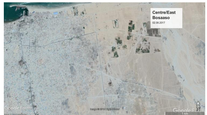
Koboca bartamaha/bariga Bosaaso 2003/2017 (Google Earth)

Intii u dhexeysay sanadihii 2005 iyo 2014, barnaamij ay isla bilaabeen dowladda hoose ee Boosaaso iyo daneeyayaal caalami ah, oo ay kamid tahay UN Habitat, waxa ay dib-u-dejin u sameeyeen qiyaastii 1700 goys oo ay dhul ka siiyeen dhinaca bari ee magaalada, marka la dhafo wadada cusub. Iyadoo lagu saleynayo hannaanka dhul bixinta wakhtiyaysan oo ay dadka ka faa'ideysanayo lahaansho buuxda u helayaan dhulka marka ay deganaadaan 15 sano, dadka dib-u-dejinta