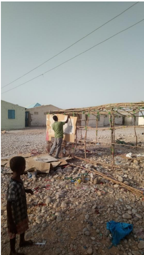
guryo dhagax iyo kartoon ah

Inta badan dadka la wareystay waxa horey loogasoo saaray goobo ay ka degganaayeen Boosaaso. Qaar ayaa ka welwelsanaa in heshiis aan rasmi ahayn oo ay ku galeen in ay goobta degganaadaan uu dhici rabo, waxana ay muujiyeen hubaal la'aan ku aaddan mustaqbalkooda. Qiimaha hantida maguurtada ah oo sii kordheysa magaalada Boosaaso ayaa ka qeyb qaadaneyso kobaca deegaannada cusub. Kasoo saarista barakacayaasha iyo dib-u-dejintooda gudaha Boosaaso waa mid socota. Dadka dib-u-dejinta loogu sameyay xaafadaha cusubna waxaa kusoo biiray qaraabadooda, barakacayaal cusubna waxa ay soo degayaan teendhooyin waxana ay heshiis isticmaal dhul la galayaan milkilayaasha dhulalka iyo dadka dib-u-dejinta loo sameeyay. Qaababkan waxaa ka dhalanaya noocyo kala duwan oo guriyeyn iyo guryo dhagax ka dhisan iyo kuwo buush ka dhisan oo isku dhex jira. Barakacayaasha cusub inta badan waxa ay dhistaan teendhooyin, waxana ay lacag kiro ah siiyaan milkilayaasha dhulka. Dadka la wareystay waxa ay sidoo kale ka cabanayeen kuleylka guryaha jiingadaha ka sameysan, oo ay inta badan dhisteen iyagoo taageero ka helaya hay'ado bixiya gargaar bini'aadamnimo.