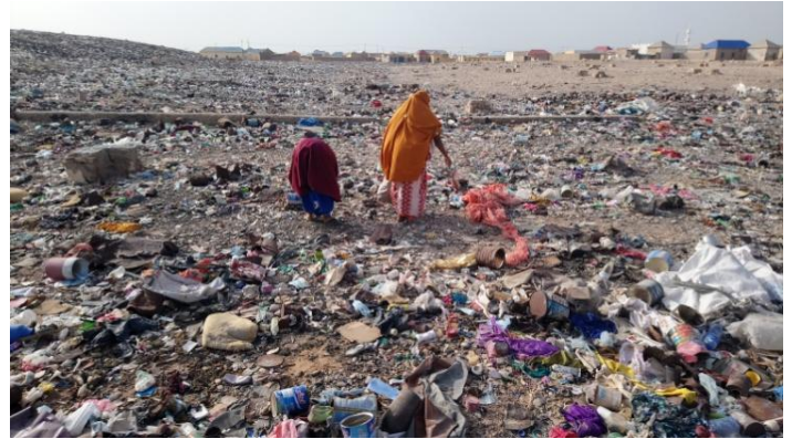
Sawir qaade: Yaasiin - Dumar wax ka dhex raadsanaya goob qashin

magaalada. Shaqaaleysiinta caruurta waa mid baahsan, tusaale ahaan wiilasha waxa ay dhex wareegaan gudaha magaalada waxana ay ku shaqeystaan caseeyenimo.