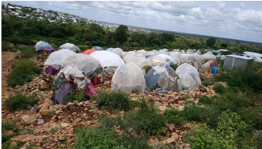
Sawir qaade: Muumino, Baydhabo - Kaam barakacayaal

(Maarso 2019) Daraasaddan waxa ay soo koobeysaa natiijooyinkii ugu muhiimsanaa ee mashruuca cilmibaarista ee Amniga iyo Dhaqdhaqaaqa ee la sameeyay intii u dhexeysay 2017-2019. Mashruuca Amniga iyo Dhaqdhaqaaqa oo ay maalgeliyeen DFID iyo ESRC waxa uu diiradda saarayay aragtiyada iyo khibradaha dadka barakacay oo deegaan ka dhigtay afarta magaalo ee Baydhabo, Boosaaso, Hargeysa iyo Muqdisho. Afartan magaalo waxa ay hoos tagaan maamullo siyaasadeed oo kala duwan, laakiin waxa ay wadaagaan dabeecado guud. Marka koowaad, waa magaalooyin si xowli ah u koraya dhanka cabbirka iyo cufnaanta, midda labaad, oo ah mid kamid ah waxyaabaha ugu muhiimsan ee keenay kobocan, waa isu guurguur xooggan oo gudaha dalka ah oo ay sababtay barakac khasab ah. Inkastoo waxyaabo badan oo la xiriira xaaladda dhaqaale iyo bulsho ee dadka barakacay ay wadaagaan magaalooyinka, waxaa jira kala duwanaa dhinaca khibrada taariikheed ee 'magaaleynta xeryaha barakacayaasha' iyo dadaallada gudaha iyo kuwa caalamiga ah ee lagu maareynayo xeryaha barakacayaasha iyo goobaha kale oo ay degaan barakacayaasha. Qoraalkan kooban waxa uu diiradda saarayaa khibrada barakacayaasha magaalada Baydhabo, oo ah caasimadda maamulka Koonfur Galbeed Soomaaliya.