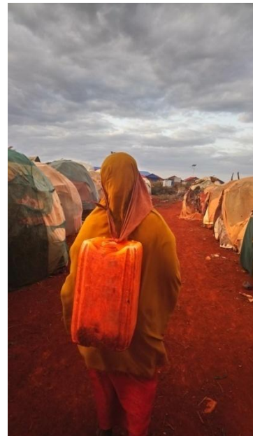
Sawir qaade: Timiro, Baydhabo – biyo aroor

Barakaca waxa ay uu kala duwan u saameyaa ragga iyo dumarka. Dumarka waxa ay inta badan dhabarka u ritaan culeyska dhaqaale ee quudinta caruurta. Waxa ay shaqeeyaan wakhti badan si ay u helaan lacag yar, waxana u wehliya masuuliyadda dheeraadka ah ee daryeelka caruurta, biyo aroorka, iyo shaqada guriya. Ragga intooda badan ma awoodaan in ay qoyska quudiyaan. Rag badan ayaa sidoo kale ku wareersan sidii ay ula qabsan lahaayeen nolosha magaalada. Jirrada iyo daalka maskaxeed ee ragga waxa ay noqotay mid lala qabsaday. Xasaradaha qoysaska waa mid ku baahsan xeryaha barakacayaasha.